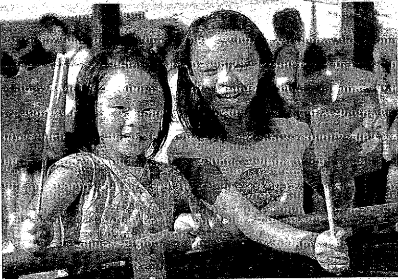
小孩子快樂與否，全仗我們伸出的援手。