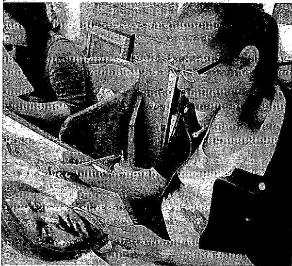
孩子也是香港未來的棟樑，大家看在眼裏，又怎可袖手旁