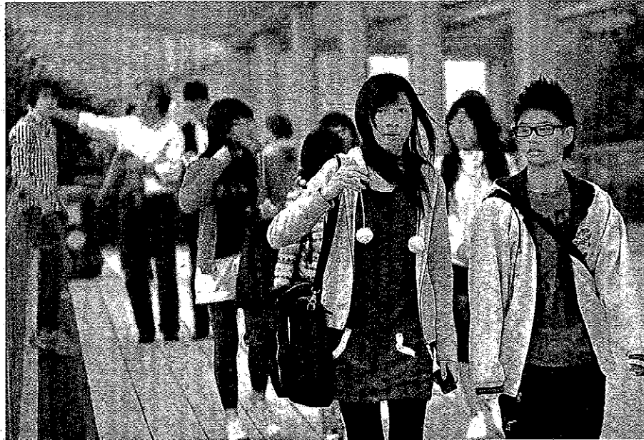
■上世紀我輩成長的年代，父母千辛萬苦供書教學，期望我們日後出人頭地，大家就不會再「捱窮」，其實，就是今天所說的「脫貧」。 (資料圖片)

上世紀我輩成長的年代，父母千辛萬苦供書教學，期望我們日後出人頭地，大家就不會再「捱窮」，其實，就是今天所說的「脫貧」。我輩做到的大不乏人，但對今天的下一代來說卻非易事。因為社會結構複雜了，單靠讓孩子接受免費教育，不足以全面扶育他們成才。所謂「一樣米養百樣人」，青少年的秉賦本已不一而足，而他們成長環境的差異，也往往出乎我們所想。以今天單一化的教育模式，實難充分發揮他們迥異的潛能，更不知多少青少年因缺乏適當的栽培而遭現行教育模式埋沒、淘汰。與此同時，就業社會甄選人才亦因而過度側重學歷成績，致使青少年失業問題更加惡化，甚至嚴重到全港雙失青少年高達 12 萬人。社會上有 12 萬人不學不上班，終日無所事事，會衍生多少深遠的社會問題，造成多大的社會負擔，難以估計。